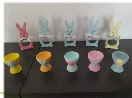
Activité de Pâques Chez Sabrina