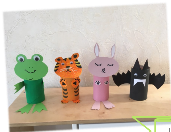
Les animaux en récup' D'Éléna

Mélangez les ingrédients et séparez en 2 la pâte. Dans 1 pâte mettre 3 c. à soupe de cacao et dans l'autre mettre 3 c. à soupe de coco râpée. Mélangez et versez dans un moule à cake les 2 préparations.. Cuire 40 min (environ) à 180 degrés.